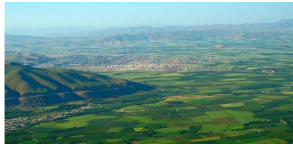
شکل ۱ منطقه کشت چغندر قند در شهرستان پیرانشهر

حاصل از فروش چغندر قند سهم قابل توجهی از درآمد کشاورزان این شهرستان دارد، بنابراین در تحقیق حاضر سعی می‌شود، پتانسیل‌ها و محدودیت‌های توسعه کشت محصول استراتژیک چغندر قند را که تأثیر سازنده‌ای بر برنامه‌ریزی مناسب در جهت توسعه این محصول دارد، شناسایی شود. لازم به ذکر است کارخانه قند پیرانشهر با جذب ۳۵۰ هزار تن و کارخانه آذوقه نقده ۲۲۰ هزار تن در زمان بهره‌برداری چغندر قند، به ترتیب مقام دوم و هشتم بیشترین چغندر قند تحویلی در سال ۱۳۹۸ را کشور کسب کرده اند. همچنین، استان خراسان، آذربایجان غربی و فارس استان‌هایی هستند که بیشترین کارخانه فرآوری شکر از چغندر را دارند. شهرستان پیرانشهر با داشتن خاک حاصلخیز و شهرستان نقده با آب مناسب برای کشت محصول چغندر قند همواره مورد توجه کشاورزان قرار گرفته است (Adibifard et al. 2019). در شکل ۱ بخشی از زمین‌های قابل کشت محصول چغندر قند در پیرانشهر نشان داده شده است.