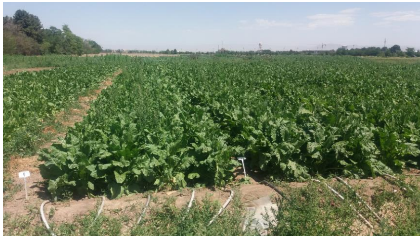
شکل ۲ تاج‌پوش گسترده چغندر قند و پوشش کامل زمین توسط این تاج‌پوش در منطقه مشهد

کنترل بیش از ۸۵ درصد (****)، کنترل ۷۰ تا ۸۵ درصد (***)، کنترل ۵۰ تا ۷۰ درصد (***)، کنترل ۳۰ تا ۵۰ درصد (*) ۱- دس‌فن‌اتو = فن‌مدیفام + دس‌مدیفام + اتوفومزیت