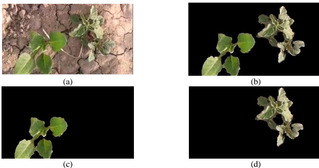
شکل ۵ (a) تصویر اصلی، (b) تصویر جداسازی علف‌هرز و چغندر قند از خاک، (c) تشخیص محصول از علف‌هرز و (d) تشخیص علف‌هرز

مطابق با آنالیز آماری صورت گرفته از میان ویژگی‌های استخراج شده از علف‌هرز و گیاه ممان سطح (ویژگی هندسی)، نسبت مساحت محدب جسم و کرویت اختلاف معنی‌داری در سطح احتمال پنج درصد وجود دارد. این مساله نشان از اولویت بیشتر این ویژگی‌ها در تشخیص علف‌هرز در مزارع غلات می‌باشد (Perez et al. 2000; Philipp and Rath 2002, Dutta et al. 2022; Jin et al. 2022; Rani et al. 2022). به‌علاوه ویژگی‌های استخراج شده در این تحقیق مطابق با