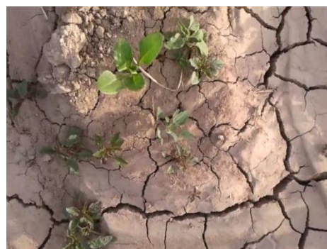
شکل ۲ نمونه ای از تصاویر گرفته شده توسط دوربین

به منظور اخذ تصاویر از یک دوربین لاجیتک (جدول ۱) که از فن آوری (RightLight 2) کمپانی برخوردار است، استفاده گردید. این فن آوری تصویر را برای بهبود کیفیت دید در شرایط نور کم، به طور خودکار تنظیم می کند. این دوربین با میدان دید عریض ۹۰ درجه، تصاویری با کیفیت Full HD 1080p در رزولوشن 1920 \times 1080 پیکسل با سرعت ۳۰ فریم در ثانیه اخذ می نماید. شکل ۲ نمونه ای از تصویر اخذ شده توسط این وب کم را نمایش می دهد.