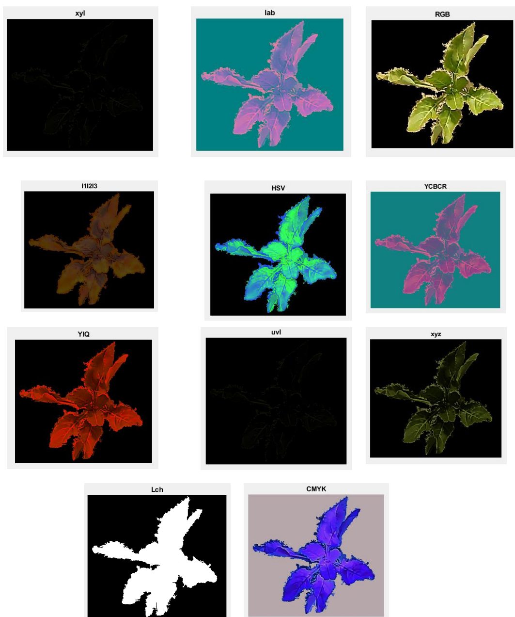
شکل ۳ نمایش فضاهای رنگی مختلف گیاه چغندر قند