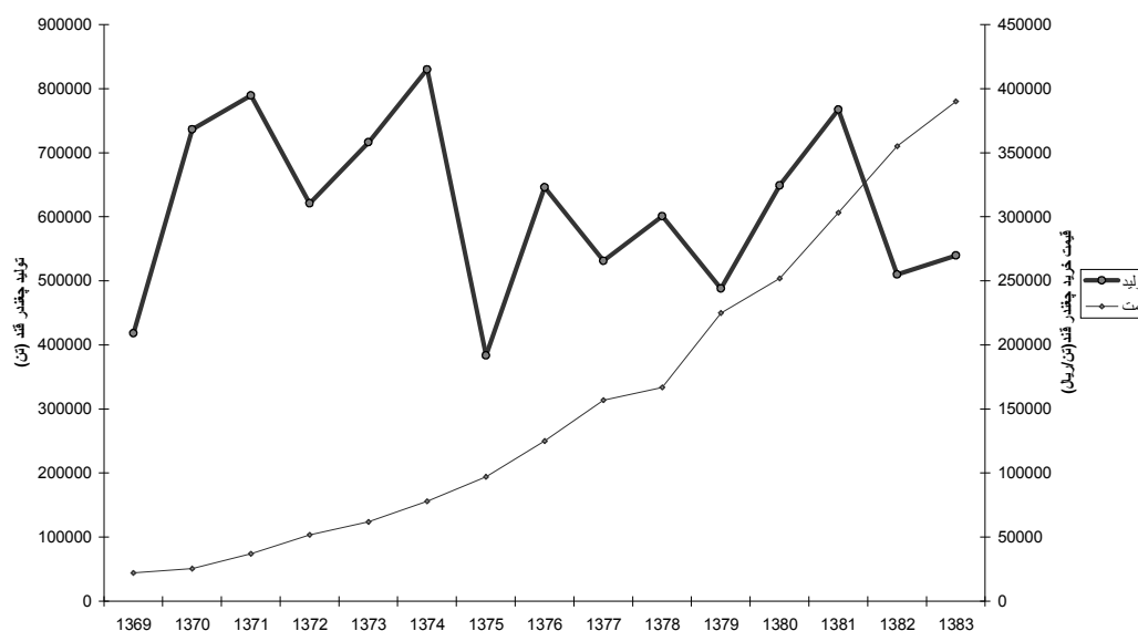
شکل ۲ روند تغییرات میزان تولید چغندر قند و قیمت خرید چغندر قند استان فارس طی سال‌های ۱۳۶۸ تا ۱۳۸۳. منبع: سازمان جهاد کشاورزی استان فارس (۱۳۸۴)

به دلیل خشکسالی در استان فارس میزان تولید به کمتر از سال ۶۹ می‌رسد. دلیل دیگر واردات شکر خام و تصفیه شده می‌باشد. میزان واردات در سال زراعی